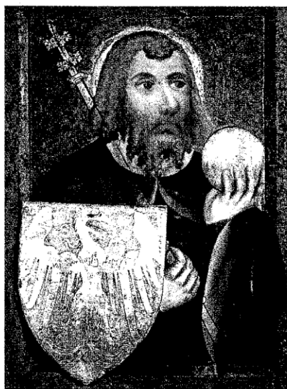
Svatý Václav je nejznámějším českým světcem a hlavním patronem České země.

Mohli ho zabít již u stolu, ale Bůh je zadržel. Václav měl zemřít až následující den, 28. září, na který ještě nepřipadala smrt žádného světce. Zvláštní důvod? Lidé ve středověku byli ale opravdu hluboce věřící a oslavy smrti světců pro ně měly velký význam.